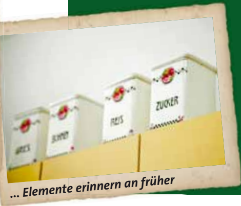
... Elemente erinnern an früher