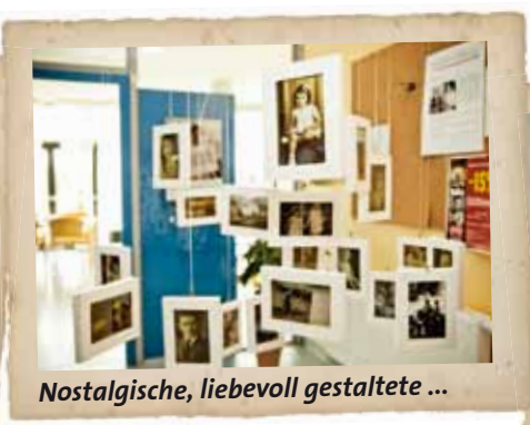
Nostalgische, liebevoll gestaltete ...